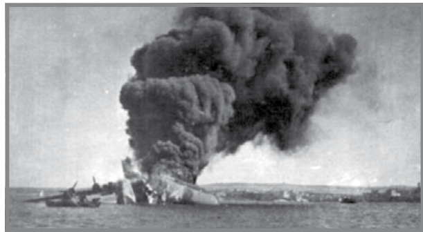
Sunderland L2164 jaqbad.

Ġie rrapurtat li waqgħu xi splinters fuq il-Melliċha. 4