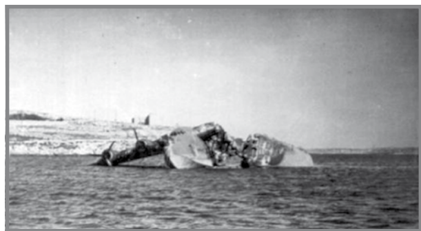
Sunderland L2164 wara li nħaraq u għereq parzjalment.