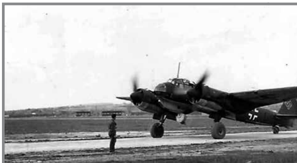
Ajruplan tal-attakk Ġermaniż tat-tip Junkers Ju88 f'wiehed mill-ajrudromi ta' Sqallija

Numru ta' ajruplani tal-ġlied tas-7/ Jagdgeschwader 26 ipprovdew skorta lil numru ta' ajruplani tal-attakk Ġermaniżi tat-tip Junkers Ju88 tan-9/Lehrgeschwader 1, 7 fejn wiehed minn dawn l-ajruplani waddab bomba fi Triq il-Mithna l-Qadima, fil-Mizieb. 8 Matul dan l-attakk, intlaqt wiehed mill-ajruplani Junkers Ju88 tad-III/ Lehrgeschwader. L-ekwipaġġ tal-ajruplan qabeż bil-paraxut; wiehed niżel fir-ranges ta' Pembroke u nqabad mall-ewwel, mentri t-tlieta l-oħra niżlu fil-baħar fejn ġew salvati minn lanċa tas-salvataġġ. 9 Kemm il-kanuni ta' kontra l-ajruplani kif ukoll l-RAF qalu li waqqgħuh huma, però jidher li l-istess ajruplan twaqqqa' minn żewġ bdoti tal-RAF Pilot Officer Anthony Rippon u Pilot Officer J.E. Hall. 10